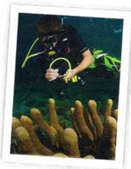
▲ KORAALVINGERS. Die koraalrif naby die eiland Tankavan was offens vlakker as die ander wat gemonitor moes word, maar niecomin indrukwekkend.

Hierdie stukkie beskermdde woud word omring deur olie-