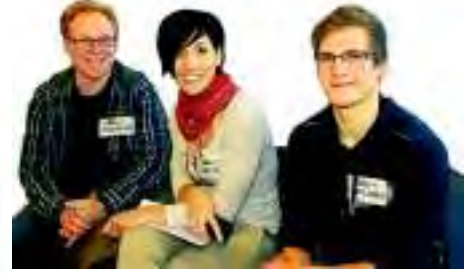
Linda de Mol wird eine neue Show moderieren, diese Teilnehmer (oben) haben sich mit ihren Gesangsproben in Stuttgart beworben.

lion Euro. Es herrschte reger Betrieb in der Liederhalle am vergangenen Donnerstag. Im ersten Stock konnten die