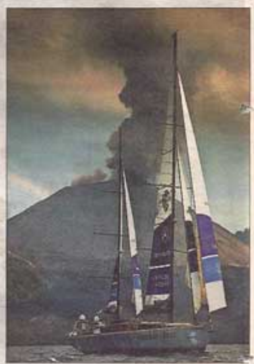
Die Segelyacht «Pangaea».